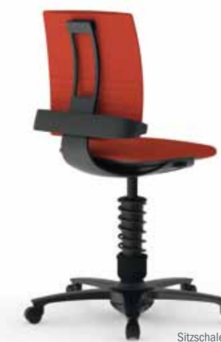
Sitzschale schwarz, Bezug Trevira coral