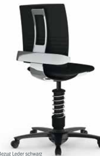
Sitzschale Alu poliert, Bezug Leder schwarz

Sicherheitsgasfeder (140 mm Höhenintervall) DIN EN 1335